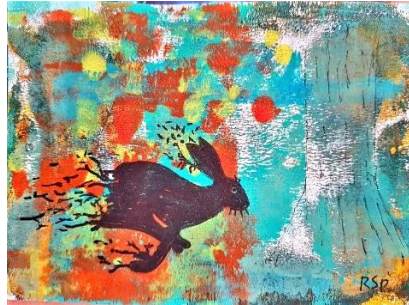
«lauf Hase, lauf» Gelli Print, nachbearbeitet Postkartengröße