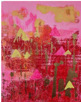
«zelten im Mohnfeld»