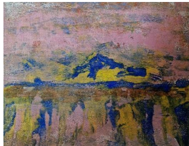
«Niesen 3» Acryl auf Papier A4