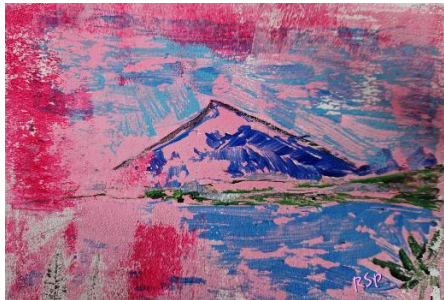
«Niesen 2» Acryl auf Papier A4

Ich habe mich in jüngster Vergangenheit mit dem Niesen beschäftigt und versucht diesen auf Papier zu bringen.