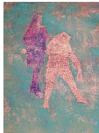
«damals als es noch Telefonbücher gab»

Alle 3 Bilder, Acryl auf Papier A4, in Passepartout, gerahmt 30x40cm