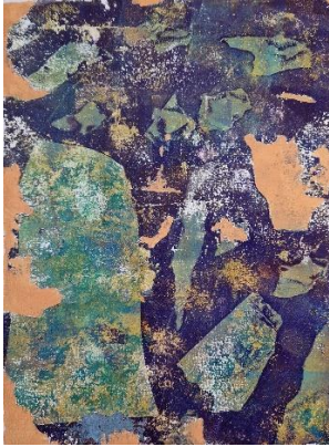
«Steininformation» Acrylauf Papier A4