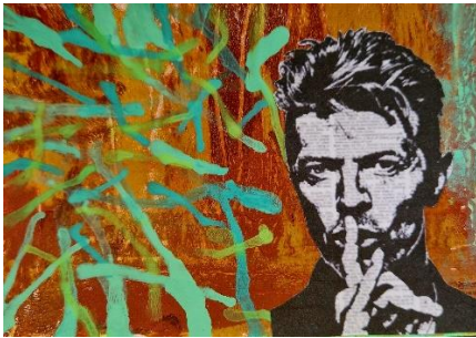
Gelli Print collagiert und nachbearbeitet Postkartengröße